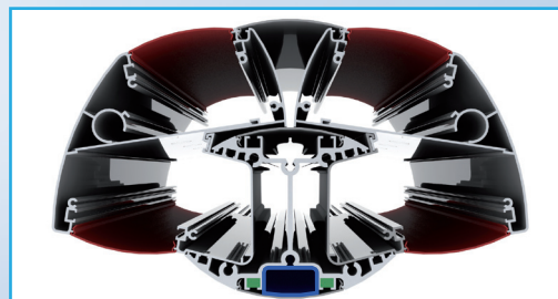
Columna de distribución y distribuidor doble

— Panel para las tomas de gas o eléctricas