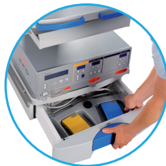
Cajonera para ordenar los accesorios del bisturí (pedales, mangos de bisturís, etc.)