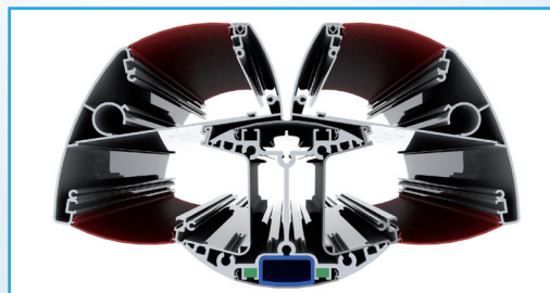
Columna de distribución y dos distribuidores simples