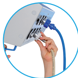
Conexión de los tubos de gas