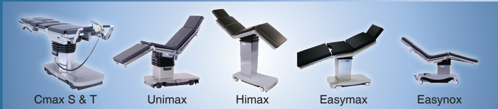
Cmax S & T