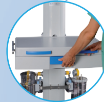
Plataforma de trabajo