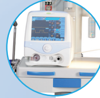
Ventilador de reanimación