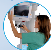
Soporte para pantalla