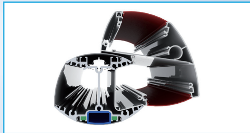
Columna de distribución y distribuidor simple