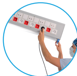
Conexión de los cables eléctricos