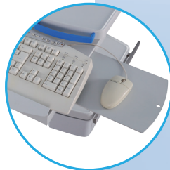
Soporte para ratón