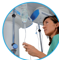
Soporte para bolsa de perfusión