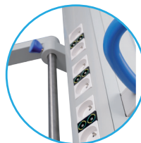
Conexión eléctrica para portajeringas