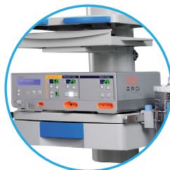
Estante para bisturí