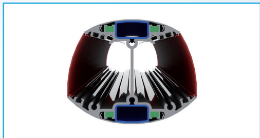
Columna de distribución