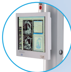
Soporte para pantalla