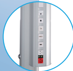
Tomas de baja tensión especiales para las señales de endoscopia