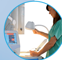
Lámpara de examen