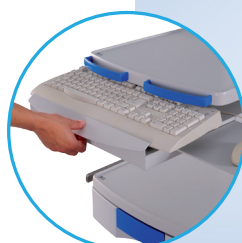
Soporte para teclado