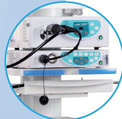
Fuente de iluminación y cámara