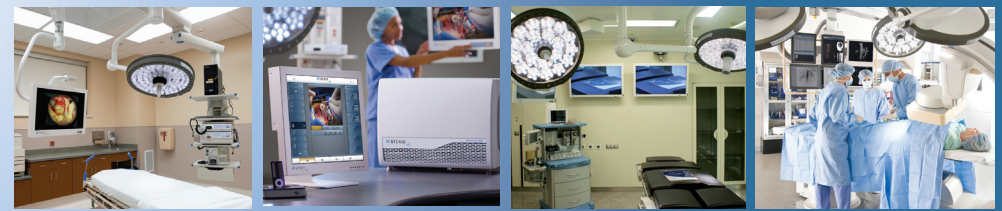
Harmony iQ 1000